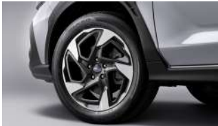
18-дюймовые колеса из алюминиевого сплава

Данные о расходе топлива получены в ходе стендовых испытаний на заводе изготовителе, без учета влияния манеры вождения, а также дорожных, погодных и прочих условий, влияющих на расход топлива. Реальные показания расхода топлива могут отличаться от указанных.